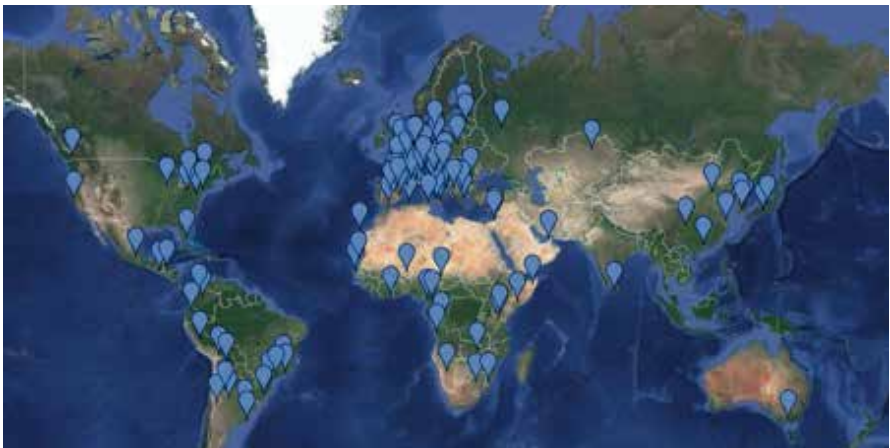
Mapa mundial de ciudades firmantes del pacto de Milán

Fruto del trabajo de reflexión y de propuestas a favor de una alimentación sostenible en la Exposición finalmente se dio un paso más allá al presentarse el documento “Pacto de Política Alimentaria Urbana de Milán” que fue firmado inicialmente por 100 ciudades en octubre de 2015.